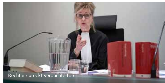
Rechter spreekt verdachte toe