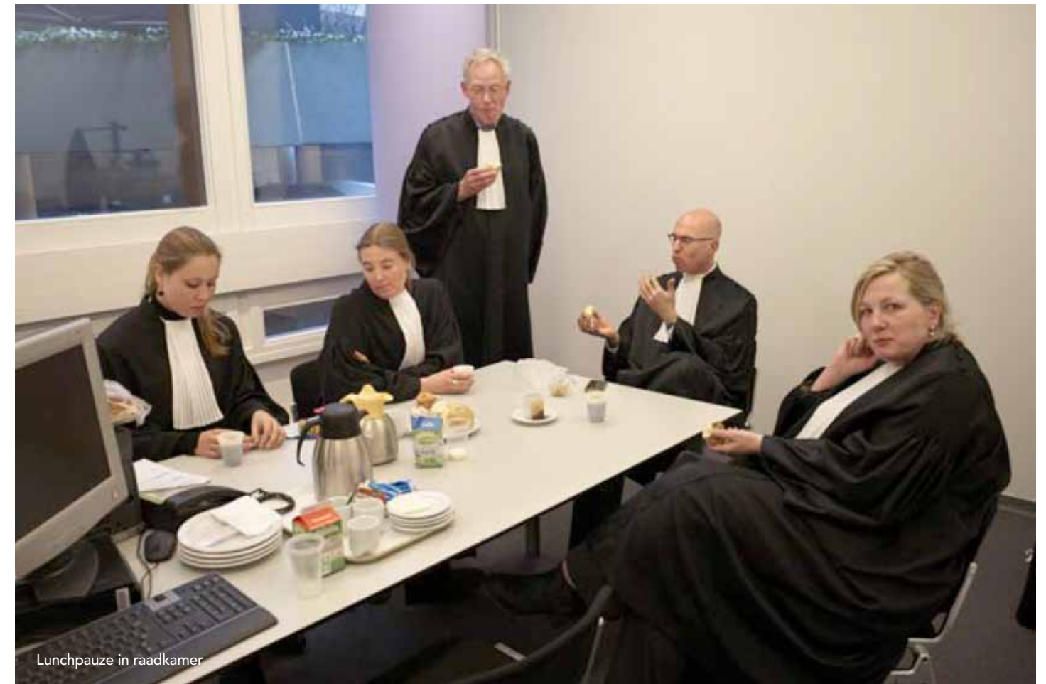
Lunchpauze in raadkamer