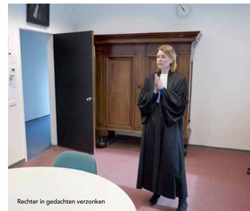
Rechter in gedachten verzonken