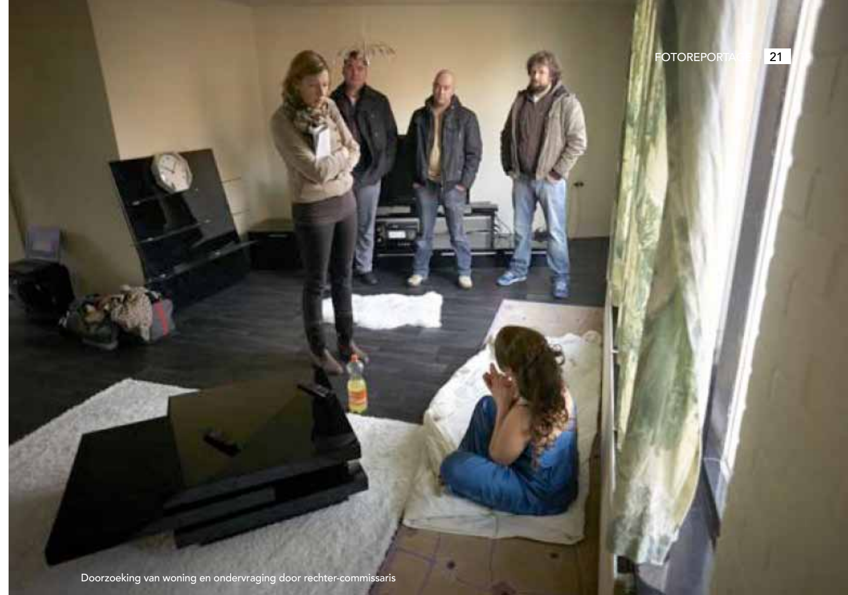
Doorzoeking van woning en ondervraging door rechter-commissaris

Op deze pagina's een impressie. Tekst: Rob Edens