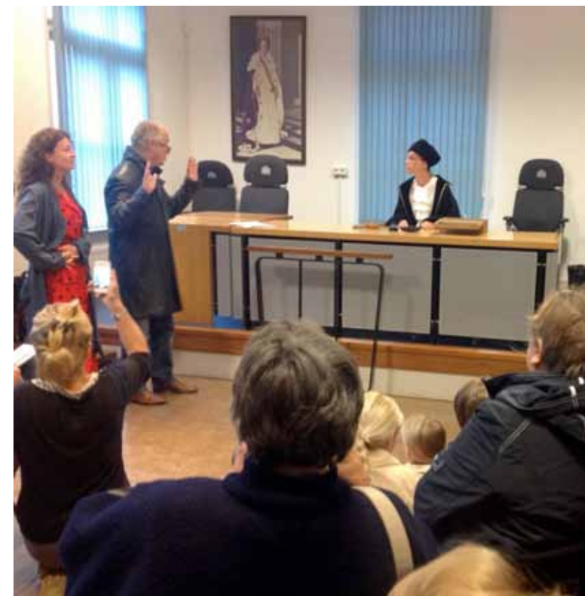
In de rechtbank Gelderland werd tijdens de Week van de Rechtspraak een eeuwenoude rechtszaak nagespeeld.

Voor meer informatie over de modernisering van rechtspraak zie het themadossier 'Modernisering rechtspraak' op www.rechtspraak.nl/Recht-In-Nederland/themadossiers