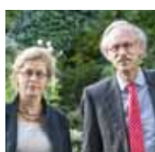
Hooglerarenechtpaar: “Rechtters mogen meer zelfverzekerd zijn”