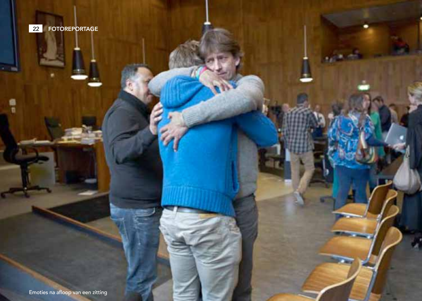
Emoties na afloop van een zitting