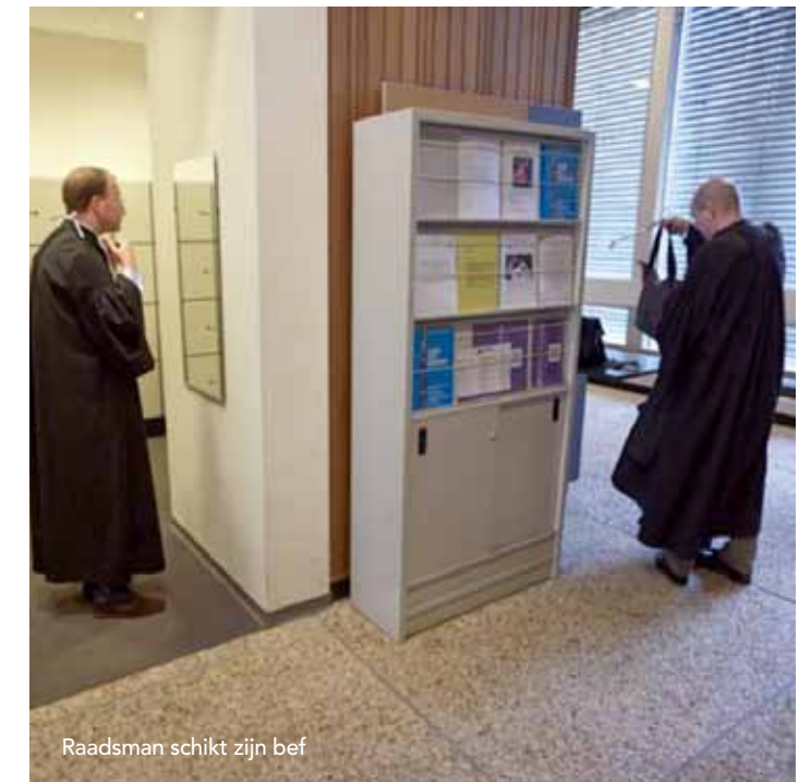
Raadsman schikt zijn bef