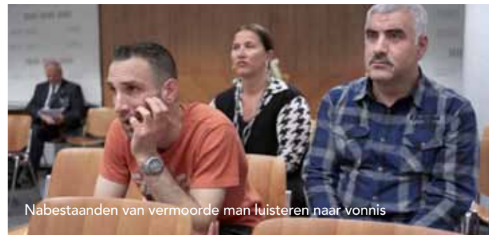
Nabestaanden van vermoorde man luisteren naar vonnis

Roel Visser, Van Rechtswege , 120 pagina's, uitgever Lubberhuizen (lubberhuizen.nl), €24,95. Het boek is te bestellen bij de uitgever en te verkrijgen in de (betere) boekhandel. ■