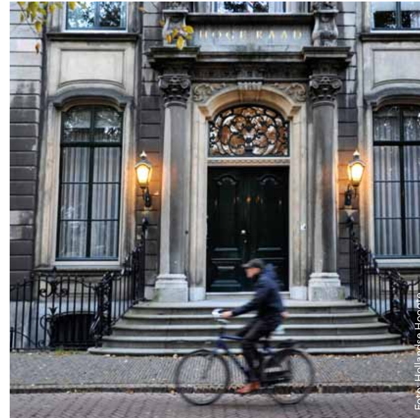
Entree van de Hoge Raad in Den Haag