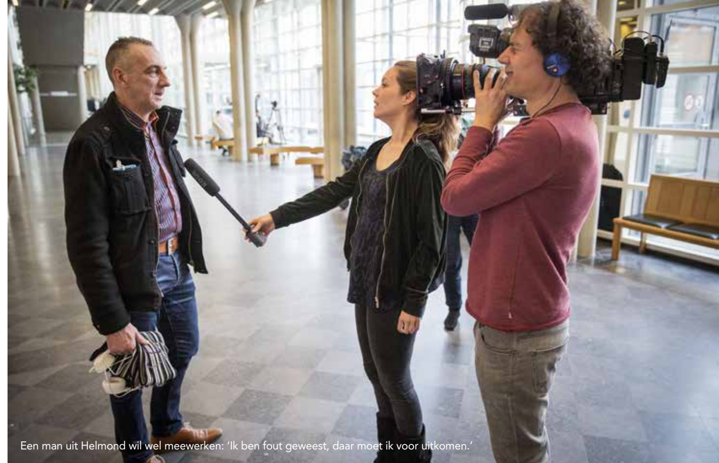
Een man uit Helmond wil wel meewerken: 'Ik ben fout geweest, daar moet ik voor uitkomen.'